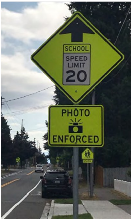
Ejemplo de una señal de advertencia de una cámara de control de velocidad en una zona escolar en Kirkland, Washington.

Debemos reducir la velocidad para salvar vidas.