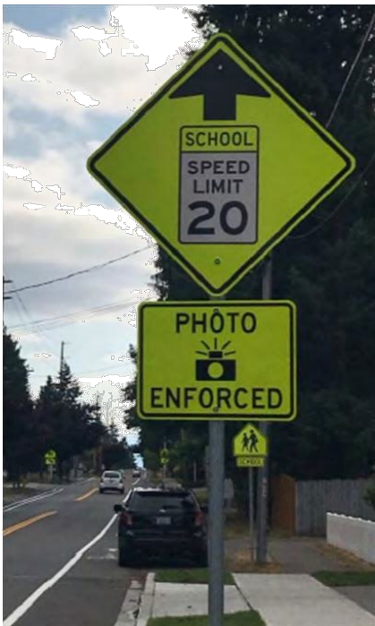
Вашингтон, Керкланд дахь сургуулийн бүсэд хурдны камер байгааг анхааруулах тэмдэг.

Бид хүний амь аврахын тулд хурдаа багасгах ёстой.