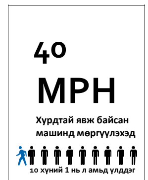
Хурд нэмэгдэх тусам, нас баралт нэмэгддэгийг харуулсан график.