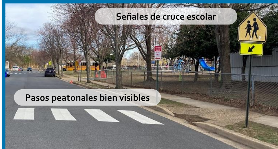
Señales de cruce escolar

¿Qué apariencia tiene una zona escolar de baja velocidad?