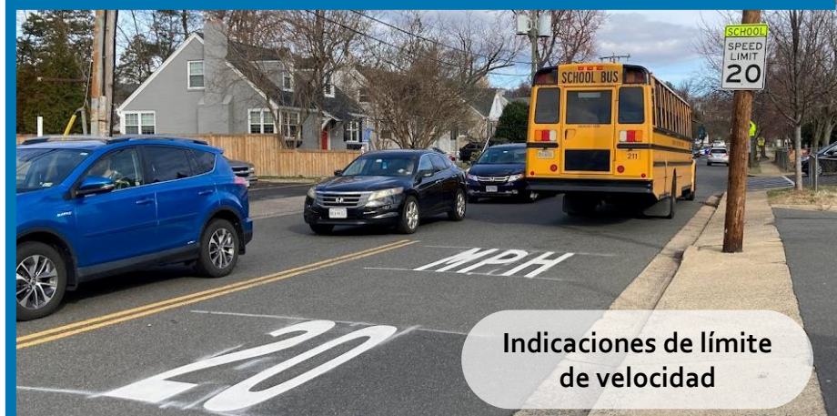
Indicaciones de límite de velocidad